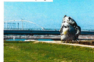
Gesicht von Nijmegen

Unser Stadtführer nimmt uns am Schiff in Empfang, und wir gehen gemeinsam ins Stadtzentrum der ältesten Stadt Hollands. Wir erfahren viel über die Geschichte Nijmegens, dessen lateinischer Name „Noviomagus“ an die römische Vergangenheit erinnert. Nijmegen war einst die größte und wichtigste römische Stadt der Niederlande. In der Zeit von ca. 20 v. Chr. bis 400 n. Chr. war dieses Gebiet durch die Römer besiedelt.