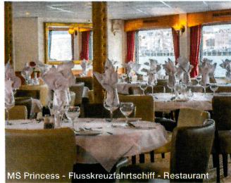
MS Princess - Flusskreuzfahrtschiff - Restaurant