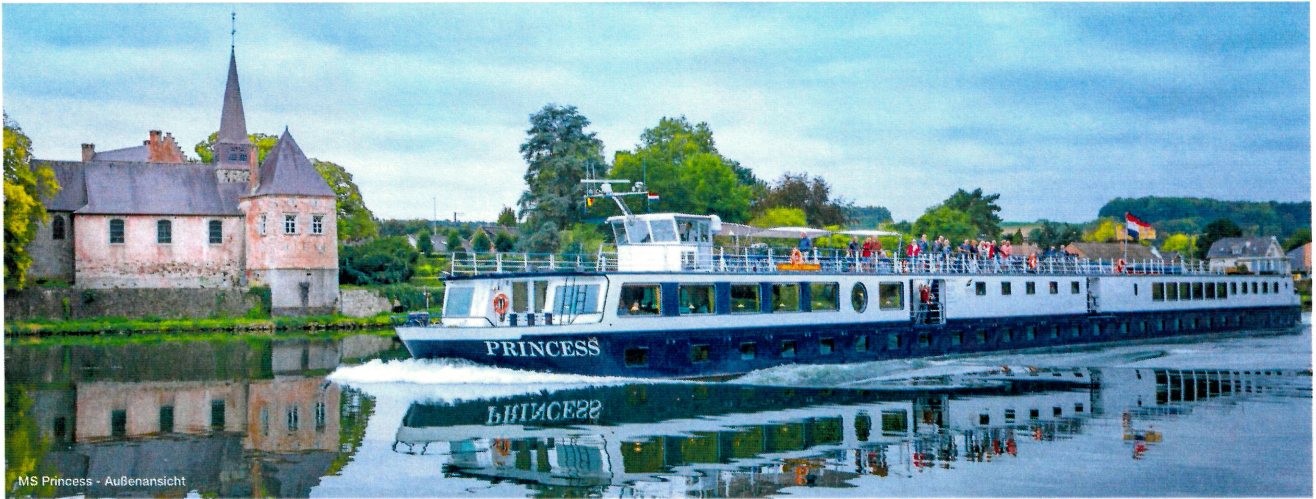
MS Princess - Außenansicht