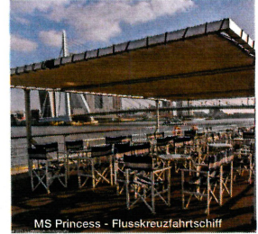
MS Princess - Flusskreuzfahrtschiff

Die PRINCESS ist ein besonders gemütliches Schiff, das jährlich vielen Passagieren einen unvergesslichen Urlaub verschafft. Dank der besonderen Maße des Schiffs kann die Princess auch viele der kleineren Flüsse und Kanäle befahren und somit in regelmäßigen Abständen in größeren Städten, wie Berlin, Prag und Brügge, anlegen.