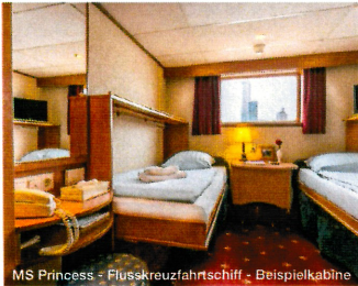
MS Princess - Flusskreuzfahrtschiff - Beispielkabine