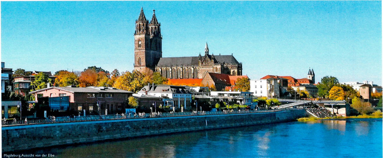
Magdeburg, Aussicht von der Elbe