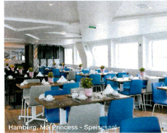
Hamburg, MS Princess - Speisesaal