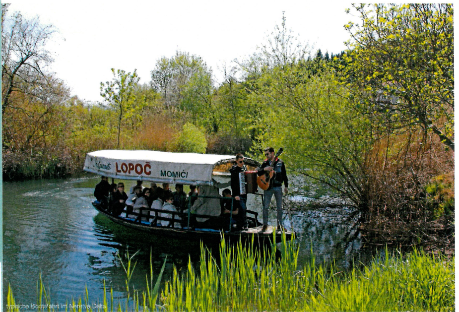
typische Bootsfahrt im Neretva-Delta