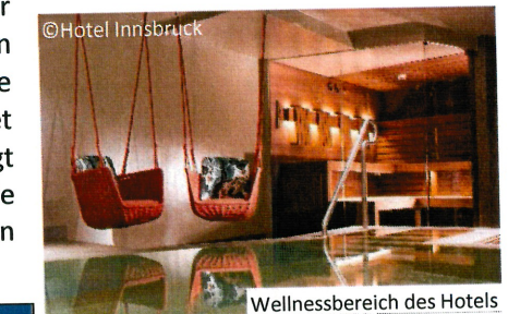
Wellnessbereich des Hotels