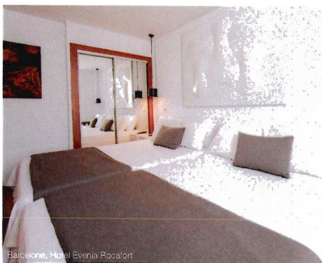
Barcelona, Hotel Evenia Rocafort