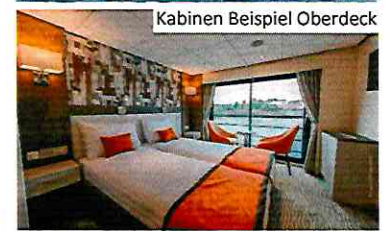
Kabinen Beispiel Oberdeck