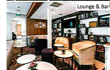
Lounge & Bar