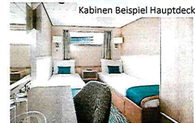
Kabinen Beispiel Hauptdeck