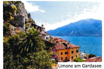
Limone am Gardasee

Nach dem Frühstück erfolgt die Rückreise im 1. Klasse-Sonderzug AKE-RHEINGOLD ab Steinach am Brenner nach Berlin.