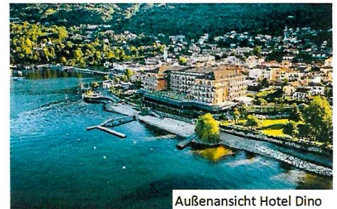
Außenansicht Hotel Dino

Mit dem 4****Grand Hotel Dino (Landeskategorie 4*) erwartet Sie ein exklusives Haus mit einer direkten Seelage und hoteleigenem Zugang zum Lago Maggiore. Die geschmackvoll eingerichteten Zimmer versprechen maximalen Komfort. Im Restaurant mit Panoramablick auf den See und die drei Borromäischen Inseln werden Sie beim Frühstück und Abendessen kulinarisch verwöhnt und der elegante Wellnessbereich mit Innen- und Außenpools garantiert Erholung pur. Zum Ortszentrum von Baveno mit Einkaufsmöglichkeiten gelangen Sie in nur wenigen Gehminuten und die Ortschaft Stresa befindet sich lediglich 3,5 km entfernt. Dank der Professionalität und der Liebe zum Detail bietet das Grand Hotel Dino seinen Gästen besondere Aufmerksamkeit und eine individuell abgestimmte Gastfreundschaft.